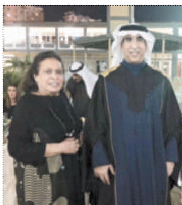
عميد المعهد العالي للفنون المسرحية مستقبلاً حياة الفهد