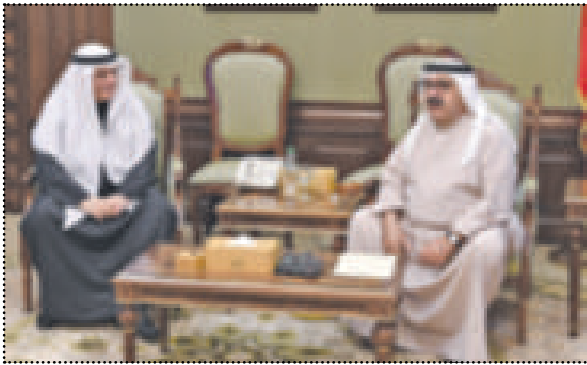
● ... ويشهد بدور البنوك في التنمية

صباح الأحمد. كما أشاد النائب الأول بالدور المتميز الذي تقوم به المصارف الكويتية في تحريك عجلة الاقتصاد، وهو ما يشكل أهمية في رسم مستقبل الكويت القادم، والذي يعتبر فيه اتحاد المصارف عنصراً مهماً في تحقيق التنمية والازدهار الاقتصادي، وأن مثل هذه اللقاءات تفسح المجال للاطلاع على الأفكار والتطلعات التي يحملها العاملون في قطاع المصارف في سبيل تحقيق أهداف التنمية المستقبلية للكويت.