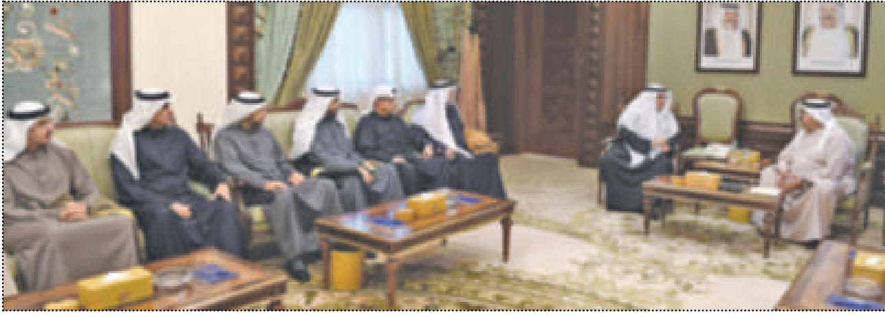
● النائب الأول متحدثاً