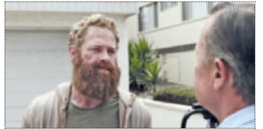
ماكس مارتيني في الفيلم